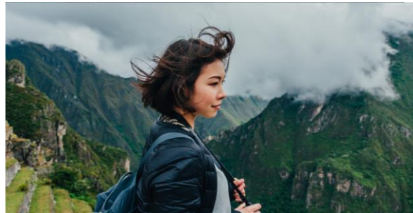
Travel Brands and Destination Rankings 2022

Laden Sie sich hier kostenlos relevante Analysen und Whitepaper von YouGov zu verschiedensten aktuellen Themen herunter.