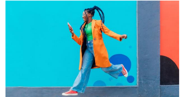
Global Telco Report 2022