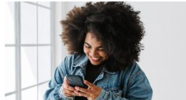
Deutscher Mobiltelefon-Markt: Quartalsbericht