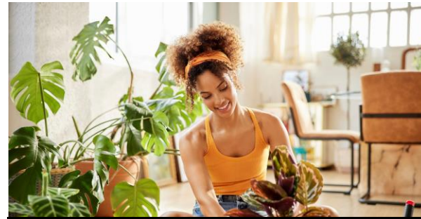
Nachhaltigkeit im Einzelhandel