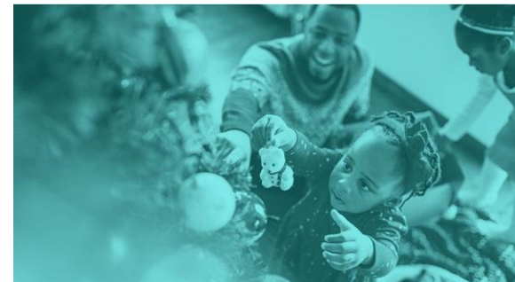
Profile Peek „Weihnachten im Schuhkarton“