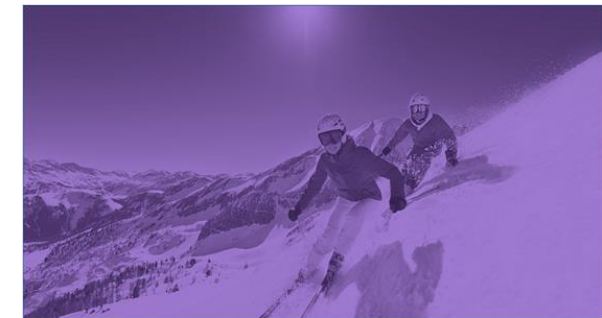
Profile Peek Winterurlauber