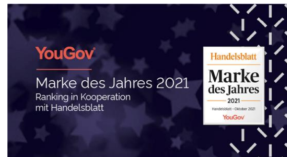
Marke des Jahres Ranking 2021