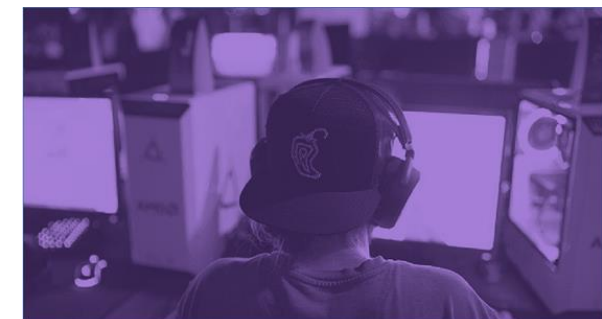
International Gaming Report 2021